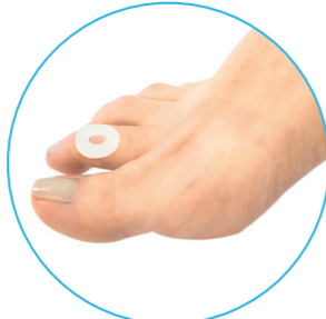
Oval Pequeño CON PERFORACIÓN PARA CALLOS

Indicaciones: Afecciones diversas en el pie.